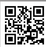
大井町 賃貸センター HP