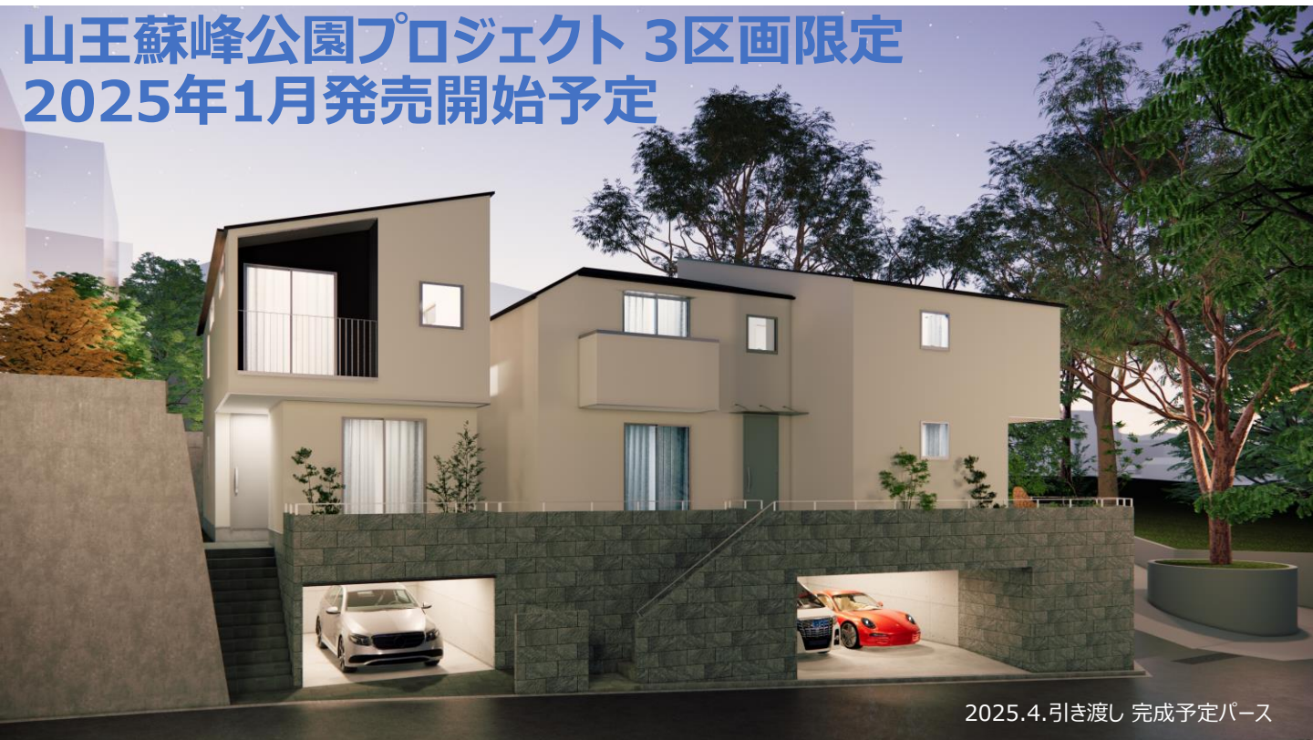
2025.4.引き渡し 完成予定パース