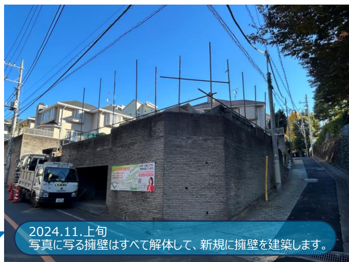
2024.11.上旬 写真に写る擁壁はすべて解体して、新規に擁壁を建築します。