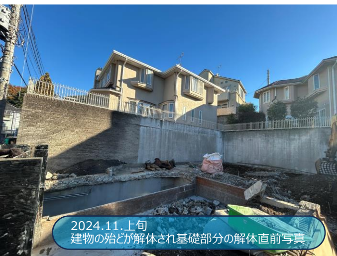
2024.11.上旬 建物の殆どが解体され基礎部分の解体直前写真

既存の擁壁は建築確認未取得の擁壁でしたので、一旦すべてを解体し、0から構造計算並びにボーリング調査を実施し、建築確認済み証まで取得してお客様に引き渡しをさせていただきます。