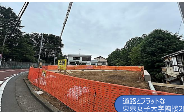
道路とフラットな東京女子大学隣接2区画