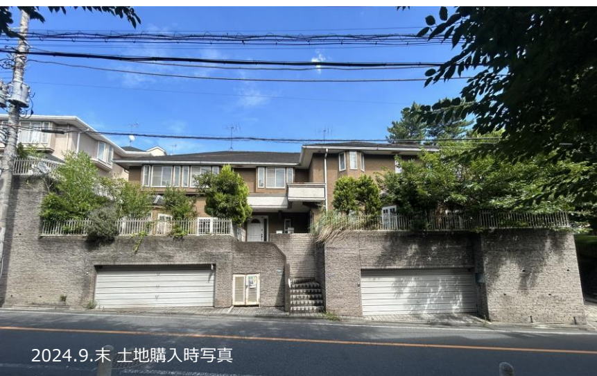
2024.9.末 土地購入時写真

敷地内の土地高低差が2m程の緩やかな南西傾斜の立地で、南側は徳富蘇峰(とくとみそほう)の居宅跡(山王草堂)を1986年に公園にした有名な公園で、園内には植え込み、梅林、池、東屋などがある回遊型庭園となっております。